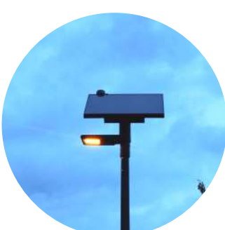
Poursuite de la modernisation de l'éclairage public