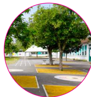
Végétalisation de la cour de l'école élémentaire Robert-Lossois