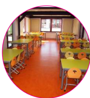
Réaménagement de la restauration scolaire