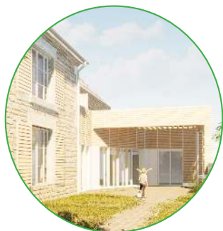
Fin de la construction de la nouvelle crèche (+ logements)