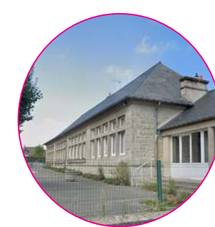
Rénovation de l'école élémentaire Robert-Lossois