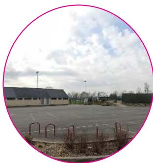
Construction de vestiaires sportifs