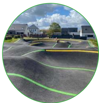
Création de sanitaires publics aux abords du pumptrack