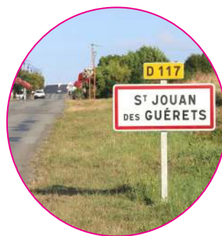
Lancement des études pour l'aménagement des entrées de bourg